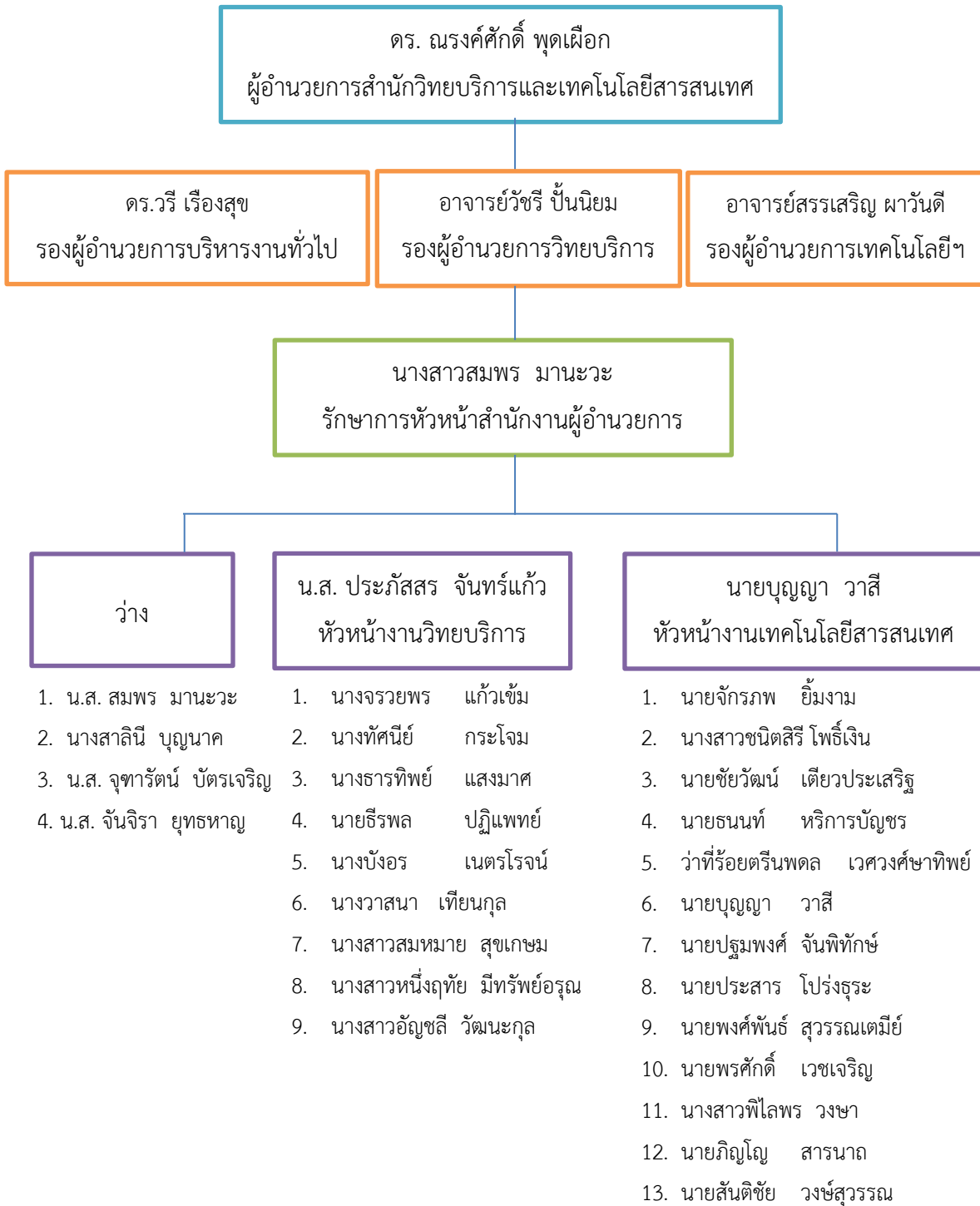
ภาพที่ 2.3 โครงสร้างการปฏิบัติงานสำนักวิทยบริการและเทคโนโลยีสารสนเทศ